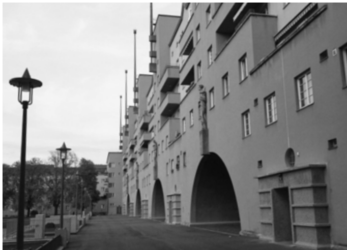
De Karl-Marx-Hof in Wenen, communale woningbouw uit de jaren twintig van de vorige eeuw die wegwijzend was.

het overige gaat het om voorraden van roerende en onroerende goederen waarvan de vervanging wordt bepaald door de levensduur. In de zeven grote industrielanden is de economische groei sinds de jaren zestig afgenomen van 5,1 tot 1,3 %. Een werkelijke vernieuwing van de economie, dus een die de houdbaarheid vergroot, zou dus moeten inhouden dat de 'ingebouwde' slijtage gelet op de omloopsnelheid met het oog op de vervanging wordt verminderd, c.q. geheel wordt tenietgedaan. Dit past in een 'economie van het genoeg' waarover wel veel gesproken wordt maar nog weinig vorderingen mee worden gemaakt. Dominante maatregelen liggen ook in de sfeer van: wat vervang je precies bij niet-repareerbaarheid? Is dat alleen het mechaniek - als het echt niet te herstellen is - of het hele apparaat. Hier hangt mee samen dat wij naar een reparatiesamenleving moeten, die weer de werkgelegenheid onder technici kan bevorderen. Begrippen uit andere ressorten des levens doen ook voor producten nu de ronde, zoals reïncarnatie en fabriceren 'van wieg tot wieg', zonder noemenswaardige 'afval'.