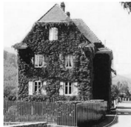
Schweitzers huis te Günsbach is nu een museum met een archief.

In 1893 bezocht Albert Schweitzer Parijs en maakte hij kennis met de grote Parijse organist Charles-Marie Widor van wie hij een leerling werd en met wie hij bevriend raakte. De orgelles werd bekostigd door een oom die koopman in Parijs was. Schweitzer was bijzonder geïnteresseerd in de muziek van Bach en bestudeerde onder andere de religieuze elementen in diens muziek. Daaruit voortvloeiend ontwikkelde en publiceerde hij een eenvoudige, onopgesmukte stijl van uitvoeren, waarvan hij vond dat die meer paste bij Bach en zijn tijd. Dit werkte hij uit in het boek over Bach, dat hij in 1905 schreef op verzoek van Widor. Schweitzers boek zette een trend die tot op de dag van vandaag de stijl van uitvoeren van Bachs muziek beïnvloedt. Hij stond ook bekend om zijn actieve belangstelling voor de constructie van het orgel.