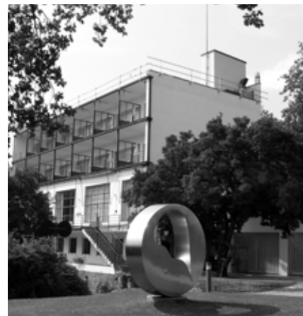
De Monte Verità bij het zuidzwitserse Ascona was honderd jaar geleden een toevluchtsoord van de Reformbeweging.

Als afnemende en verder bedreigde levenscondities een ramp zijn, en dat zijn ze, dan worden over een lange duur zich voltrekkende rampen niet als zodanig gevoeld. De factor