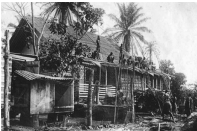
De barakken te Lambaréné zijn in aanbouw.