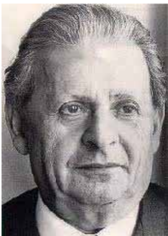
Het aangezicht van de ander speelt een belangrijke rol bij Levinas.

slechts datgene te willen wat hun direct plezier en bevestiging verschaft. Het toelaten en zelfs stimuleren van een dergelijke houding bij het publiek betekent dat men het infantiliseert, aldus Furedi, en dat gebeurt in onderwijs, bij cultuurinstanties en op de televisie. In de afwijzing van dit soort identificatie kan men steun vinden bij vooral joodse denkers. Zo is er bij de filosoof Theodor Adorno (en ook wel bij anderen van de zogenoemde Frankfurter Schule) het verzet tegen de dominantie van een denken dat de wereld bevestigt 'zoals deze is', tegen wat hij het 'systematische, identificerende denken' noemt: het werken met eenduidige begrippen, het abstract en algemeen maken wat concreet en bijzonder is en aldus elk perspectief op 'iets anders' bemoeilijkt.