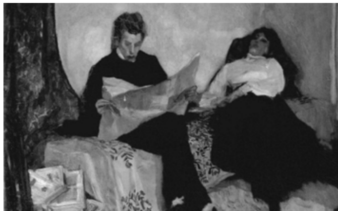
De student Theodor Heuss als krantenlezer op een schilderij van Albert Weisgerber (Museum Georg Schäfer, Schweinfurt).

eerste decennia van de twintigste eeuw, waarin Heuss voor het voetlicht trad als journalist en cultuurorganisator, worden vooral diens contacten met Friedrich Naumann, een sociaal bevlogen predikant die een spilfunctie had in het debat, beschreven.