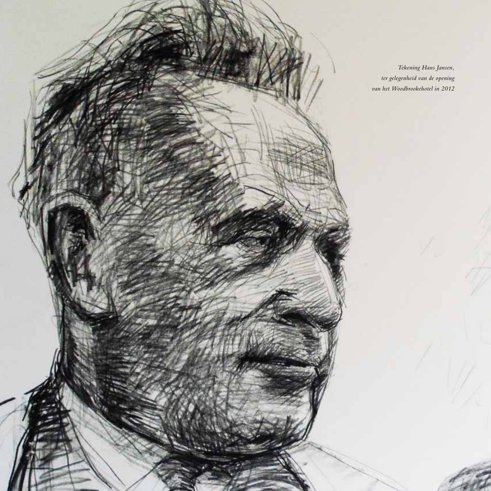
Tekening Hans Jansen, ter gelegenheid van de opening van het Woodbrookehotel in 2012