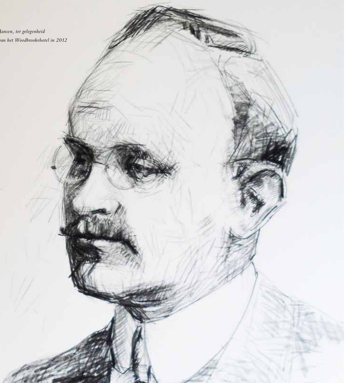
Tekening Hans Jansen, ter gelegenheid van de opening van het Woodbrookehotel in 2012