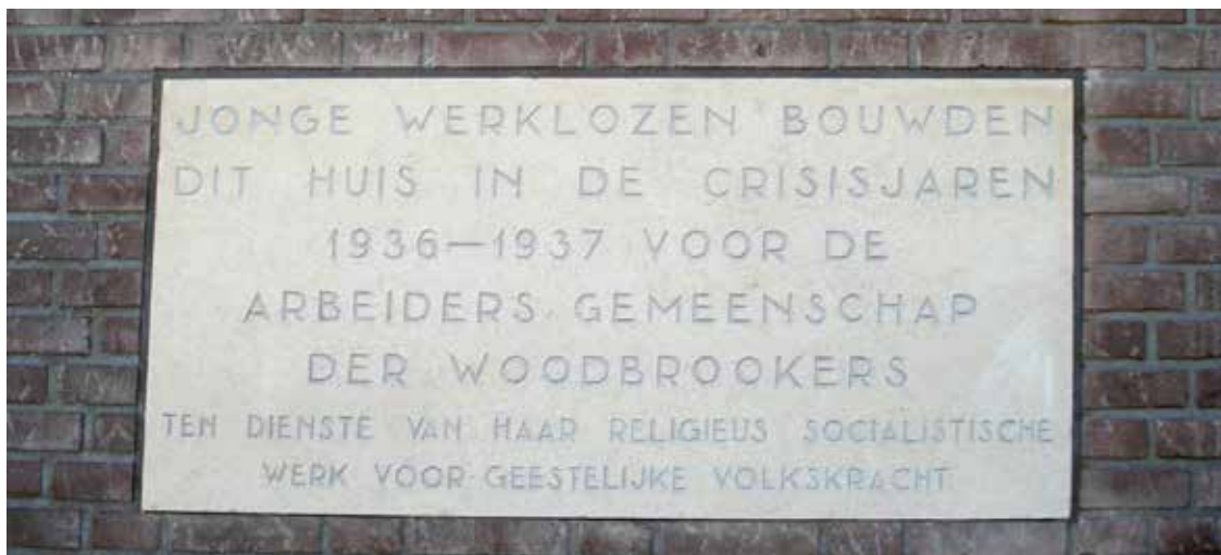
Foto: De in de muur gemetselde gedenksteen voor de jonge werklozen

De nadruk op het vormingswerk zoals dat onder leiding van Van Biemen in Bentveld en van Bijleveld in Kortehebben vorm kreeg had een groot voordeel en een groot nadeel. Voordeel was dat het werk op beide locaties van aanzienlijke kwaliteit was. Er waren tal van cursussen met telkens een behoorlijk aantal cursisten, de centra groeiden en stonden bekend om hun inhoudelijke kwaliteit. Nadeel was dat de vaste verbinding tussen denken en vormen zoals die voor