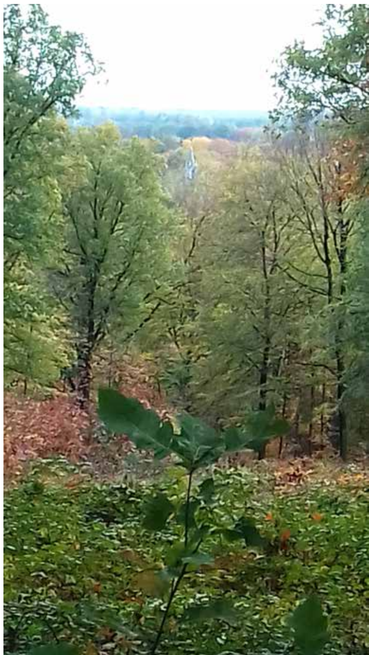
Mooie zichtlijn van Kalenberg naar kerkje in Barchem